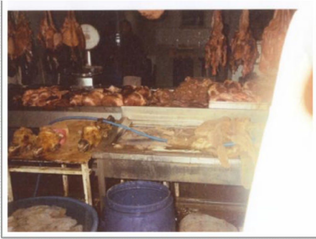
Resim 10: Sakatatçılar çarşısında bir tezgâh