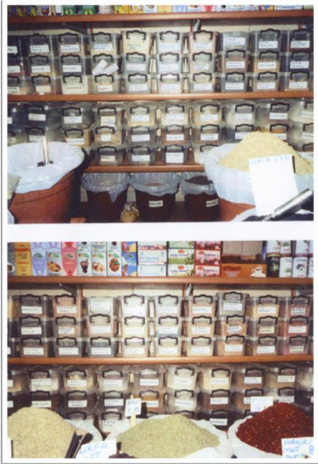
Resim 18: Aktarda satılan baharat ve bitki tozları