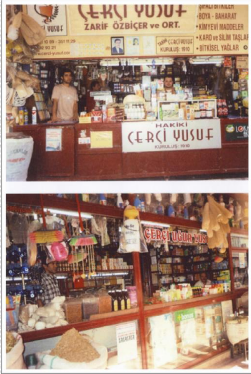
Resim 8: Saydam caddesinde iki farklı aktardan görüntüler