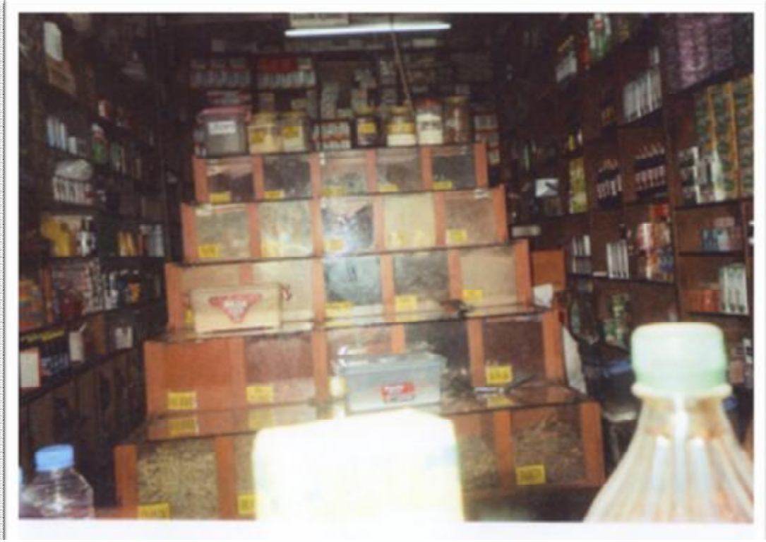
Resim 20: Halk ilacı yapımında kullanılan çeşitli otlar