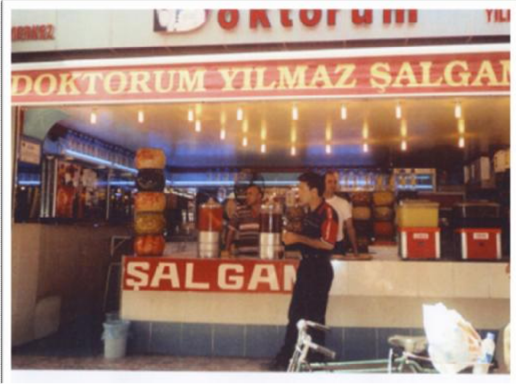
Resim 6: Adana Mısır çarşısı girişinde bir şalgamcı