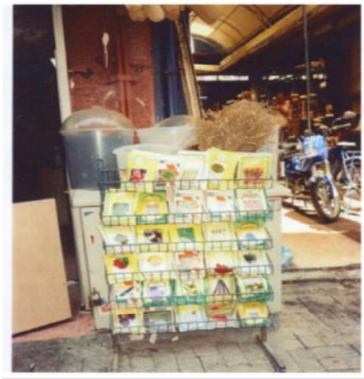
Resim 15: Yol kenarında satılan çeşitli bitki tohumları