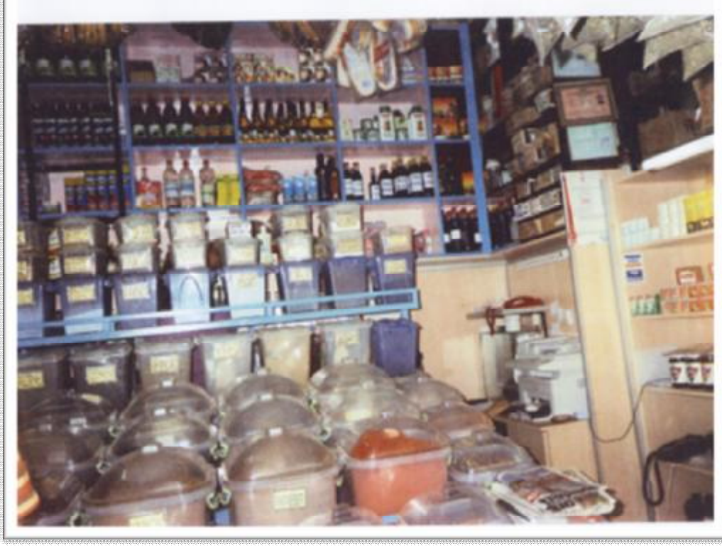
Resim 14: Halk ilacı yapımında kullanılan baharatlar