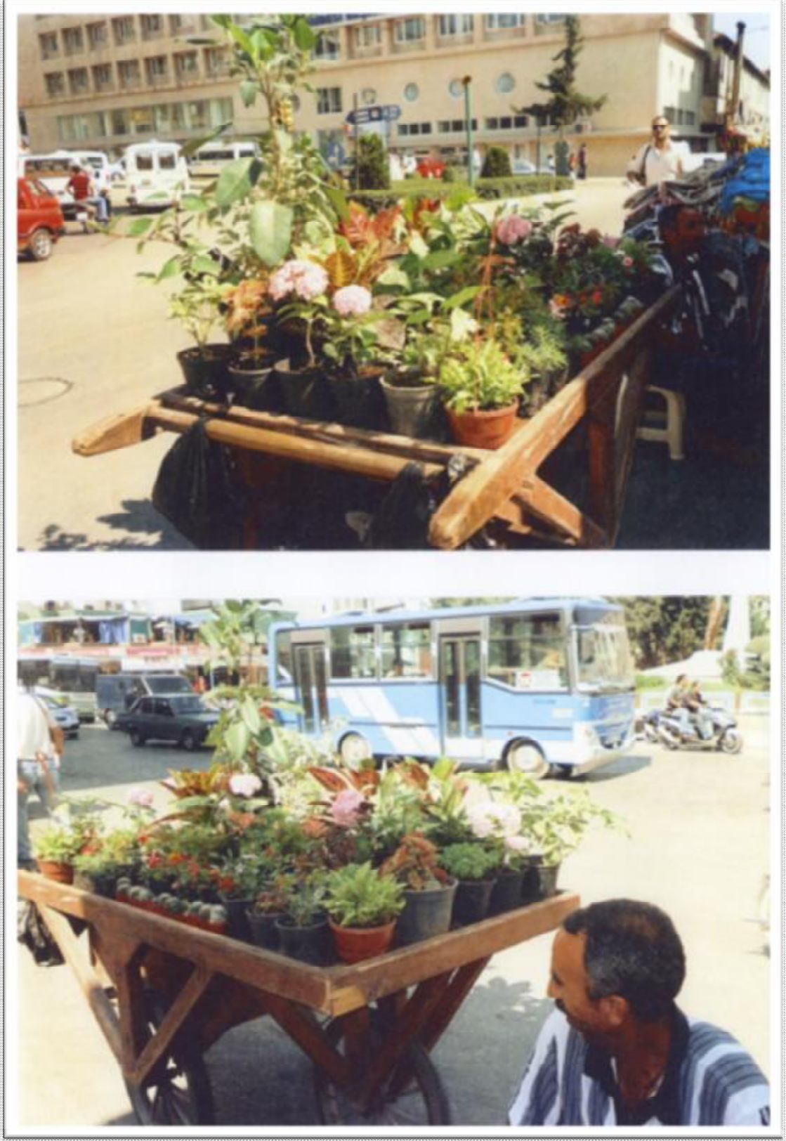
Resim 3: Adana 5 Ocak meydanında bir çiçekçi