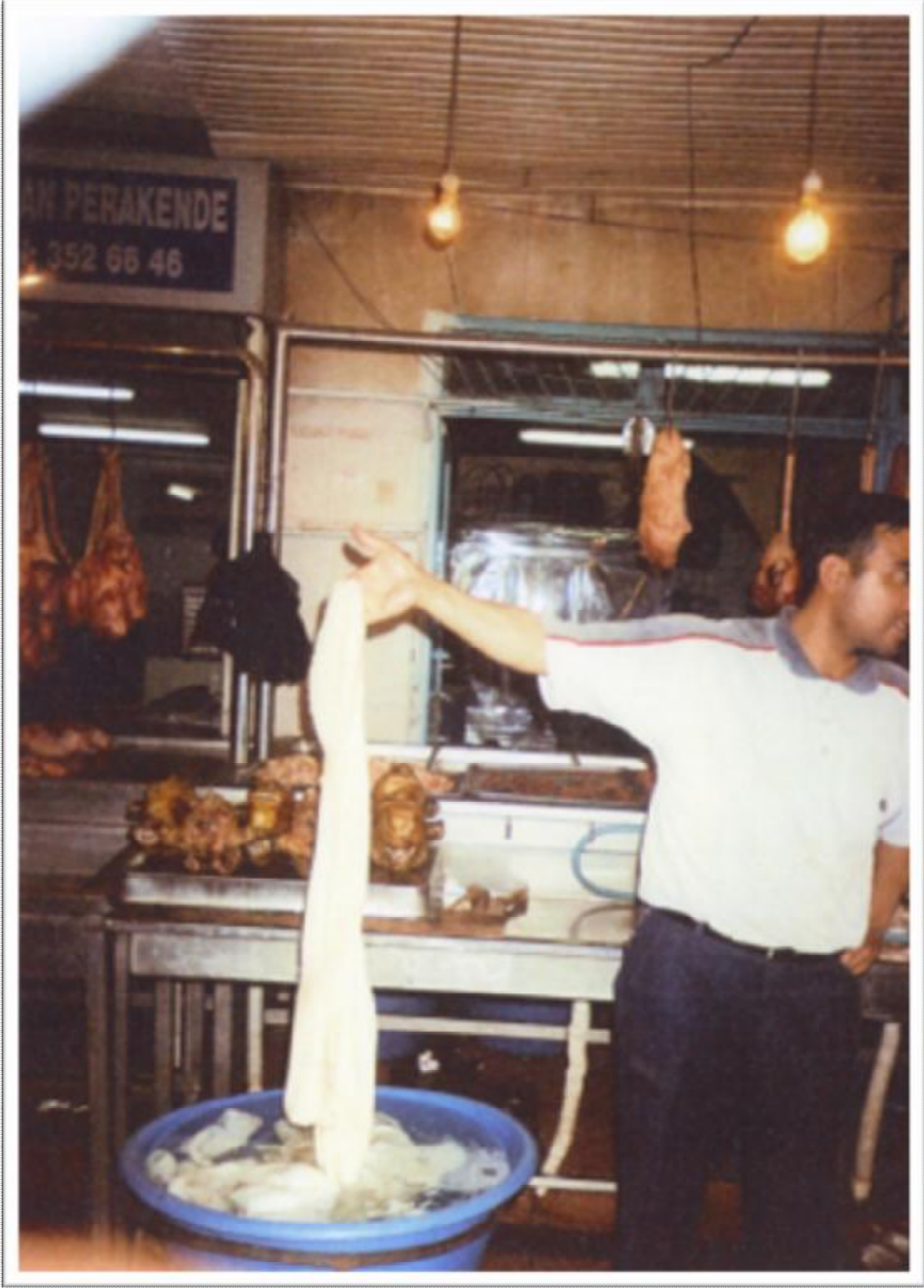
Resim 2: Adana sakatatçılar pazarında bir işkembe satıcısı