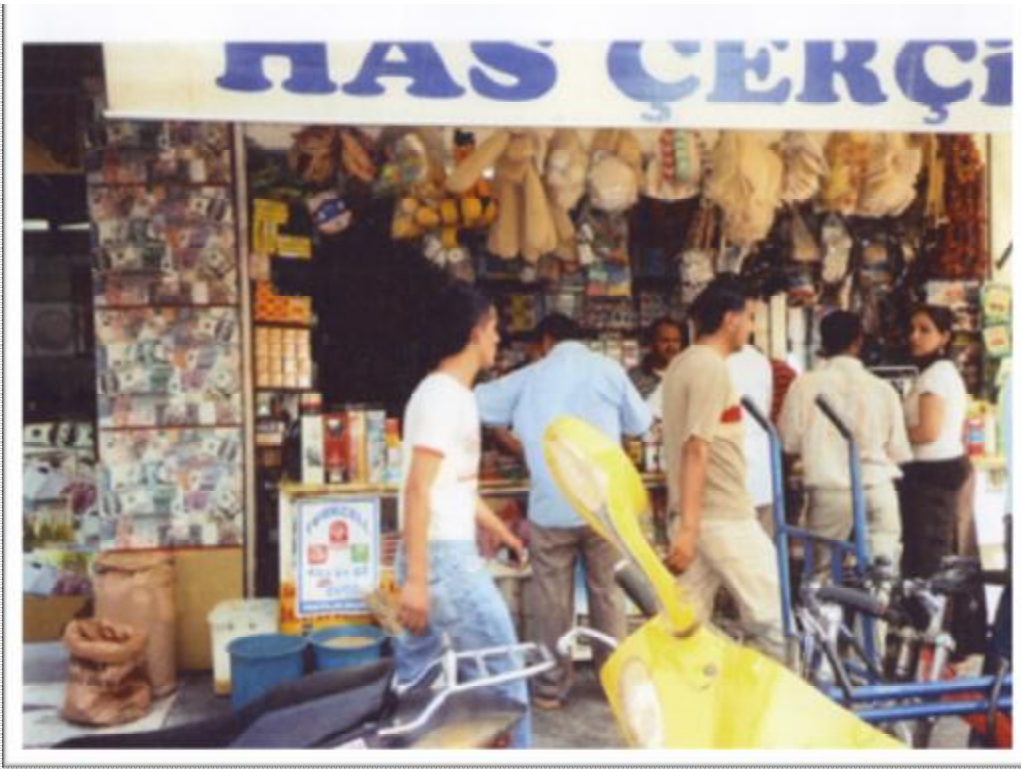
Resim 5: Saydam caddesinde bir aktardan görünüş