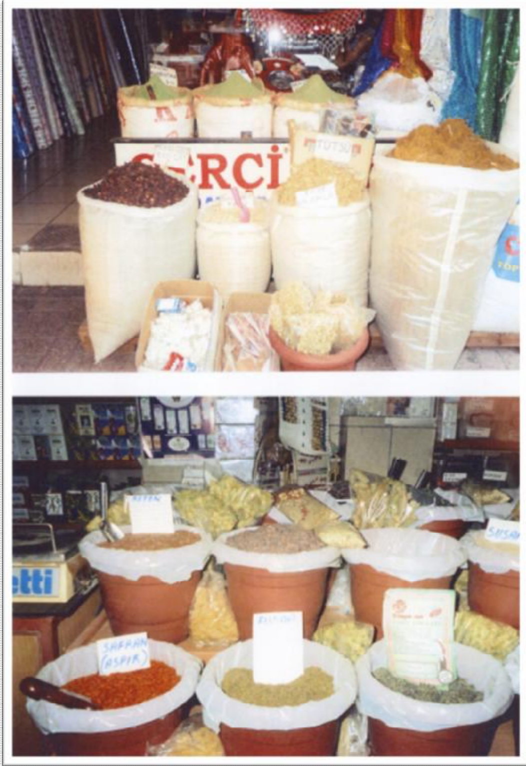
Resim 19: Şifalı bitkilerden bir görüntü