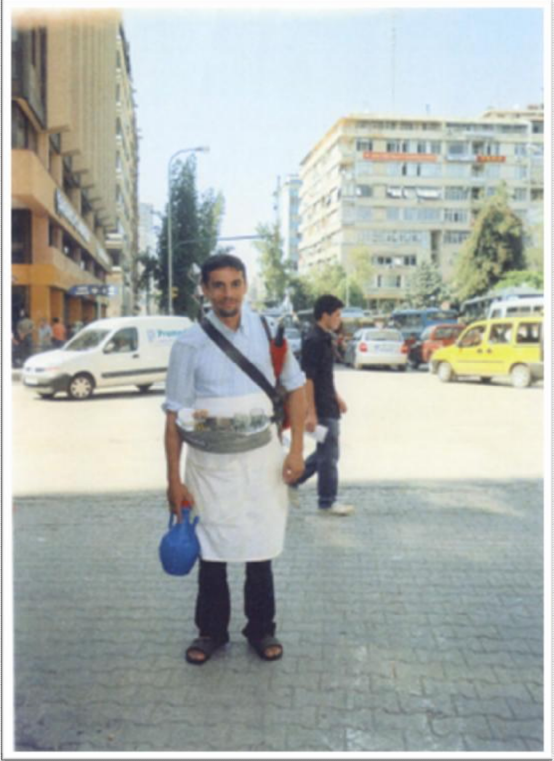
Resim 1: akmak caddesinde bir meyan kk (ařlama) satıcısı