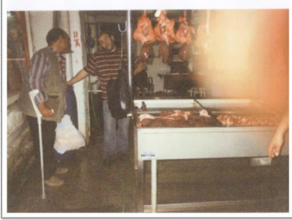
Resim 11: Sakatlar arşısında bir tezgâh