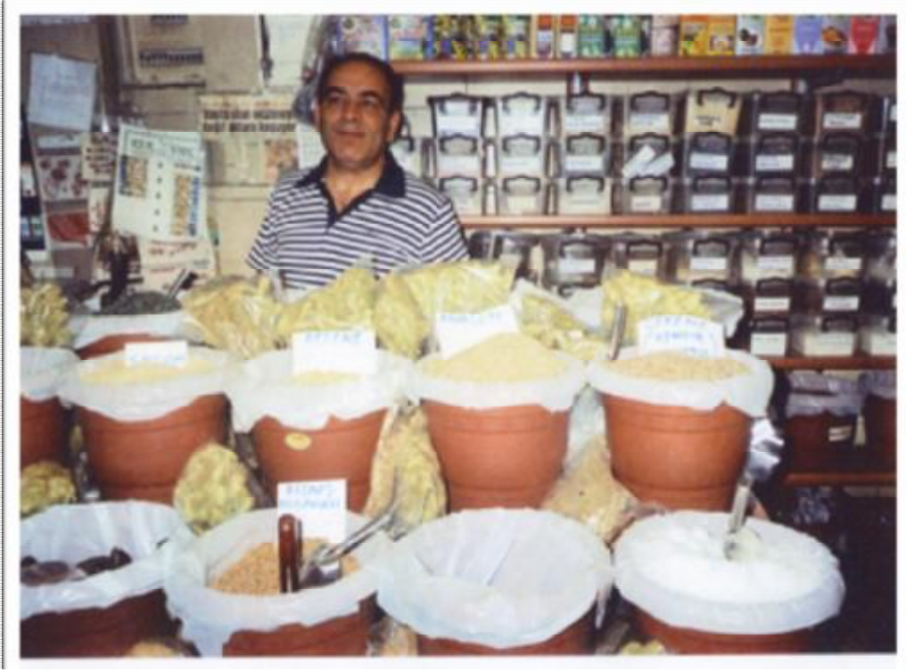
Resim 16: Saydam caddesinde bir başka aktar ve ürünleri