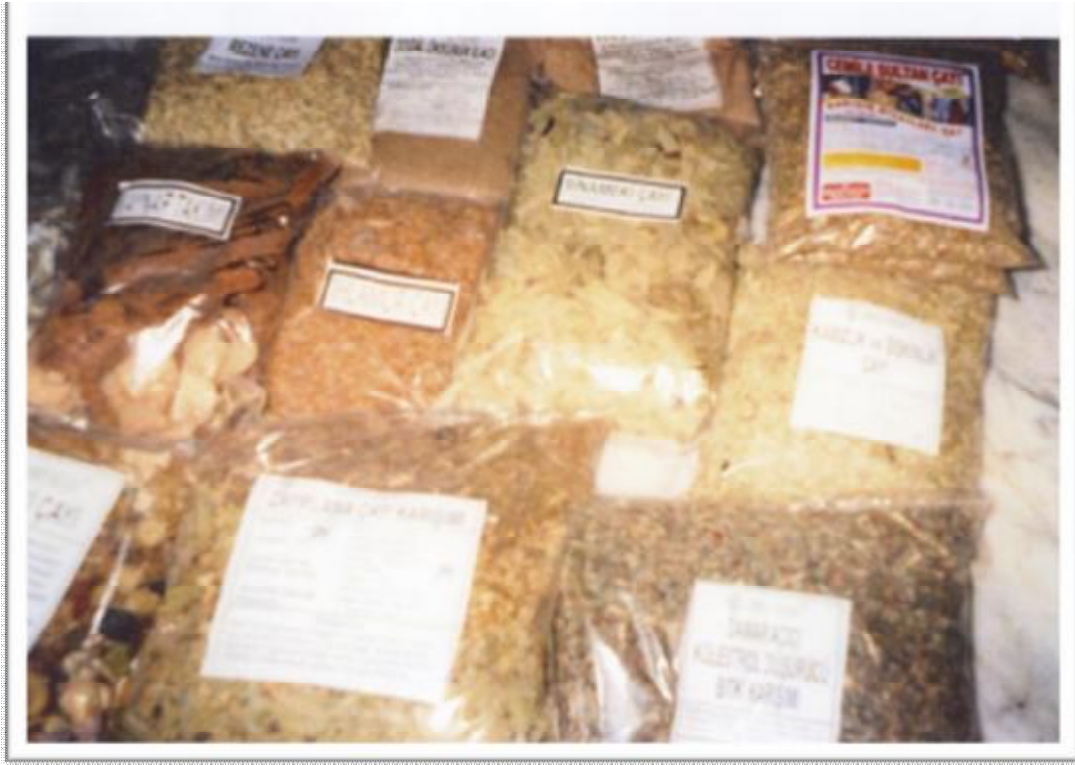
Resim 21: Aktarların kendi hazırladıkları bitkisel karışımlar