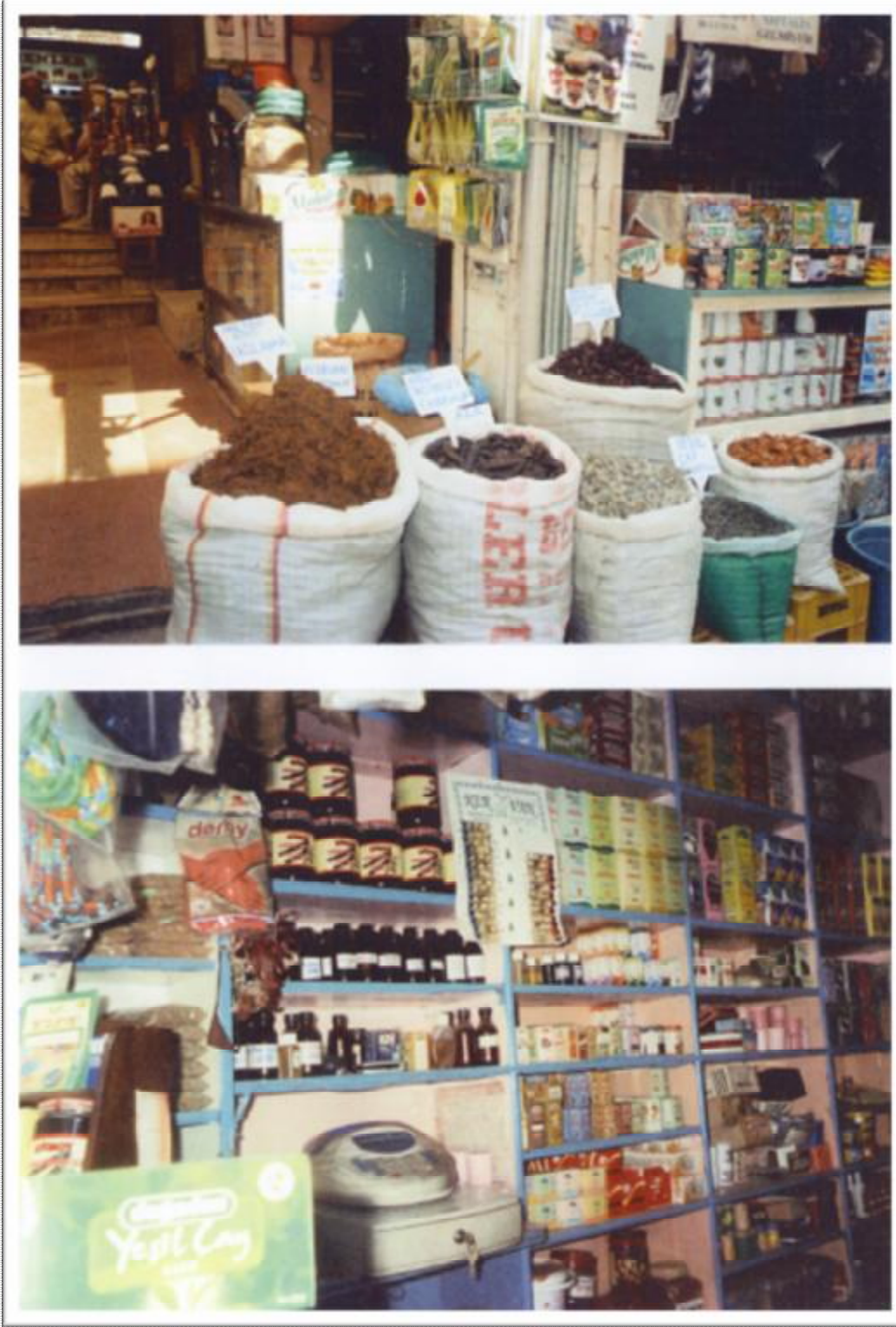
Resim 13: Aktarda satılan şifalı kuru bitkiler