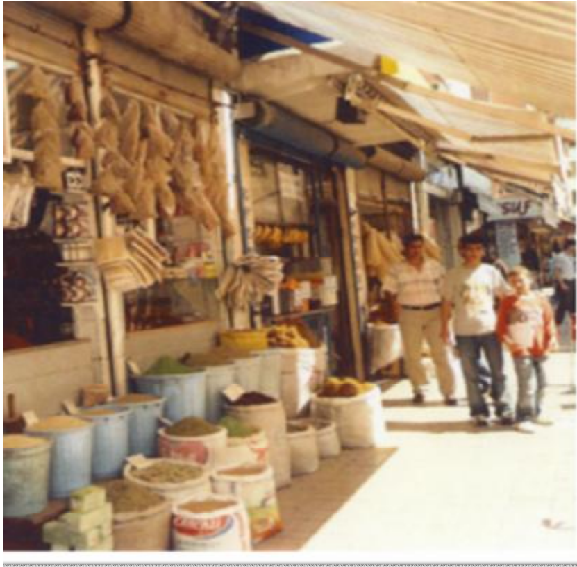
Resim 17: Bir aktardan görüntü