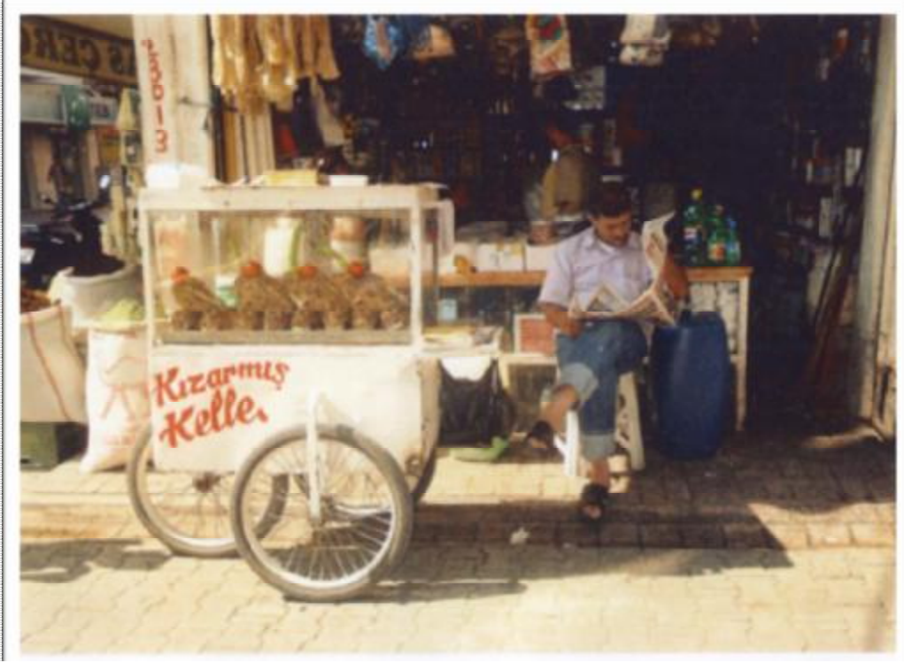
Resim 4: Sakatlar pazarının girişinde bir seyyar satıcı