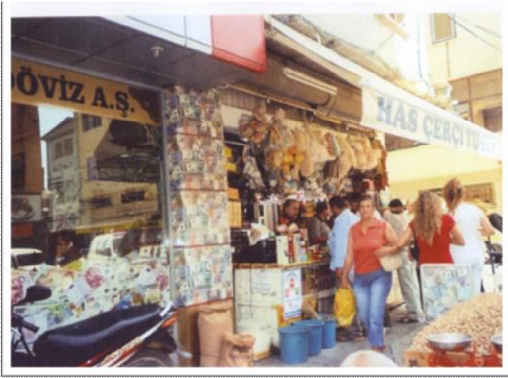
Resim 7: Aktarda satılan çeşitli ürünler