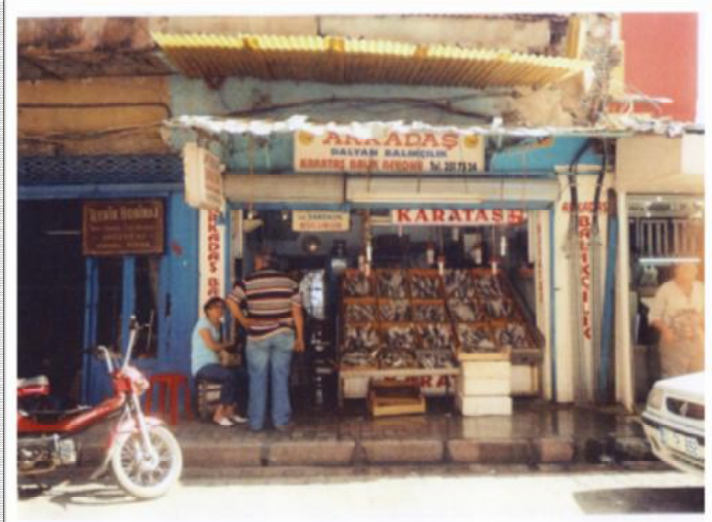
Resim 12: Obalar caddesinde bir balıkçı tezgâhı